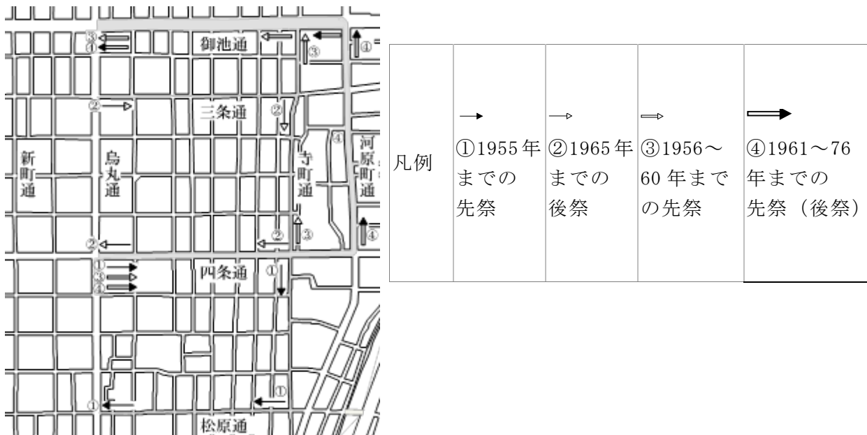
図-1 巡行路の変遷『近世祇園祭山鉾巡行志』を基に筆者作成

すなわち、御池通は、新しいメインストリートとして期待されていた。そこで、1956年～1967年に行われた巡行路変更に注視し、各通りの資質が時代に適しているのかどうかを明らかにすることは、本来の山鉾巡行の役割を知る上においても、今後の山鉾巡行のあり方を探ることにおいても意義があると考えられる。